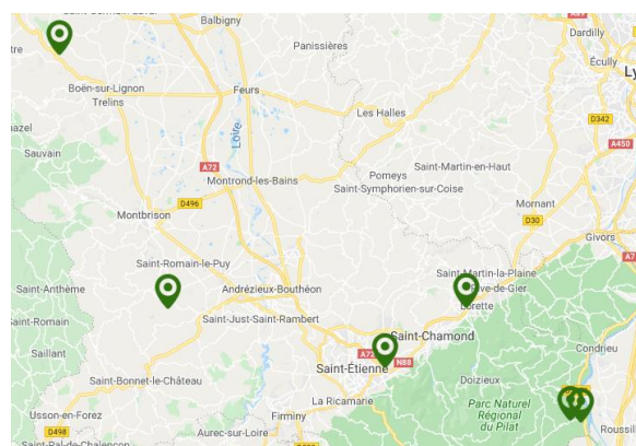
Carte : Nids de frelon asiatique détruits sur le département de la Loire en 2019

Les conditions climatiques de l'année semblent avoir été défavorables au prédateur. Malgré tout, le frelon asiatique continue sa progression.